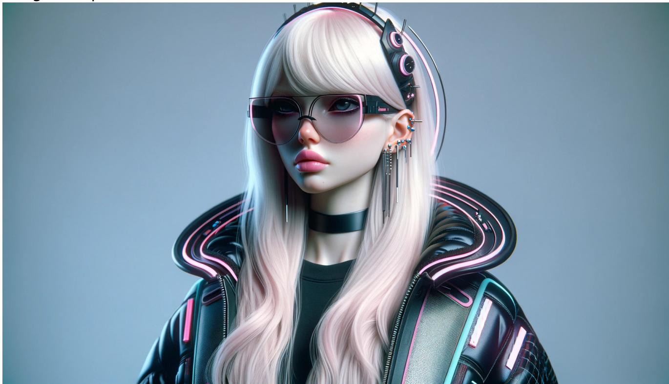
Imagen de portada

Enviado por 1020717891 el Mar, 16 Dic 2025 - 20:28