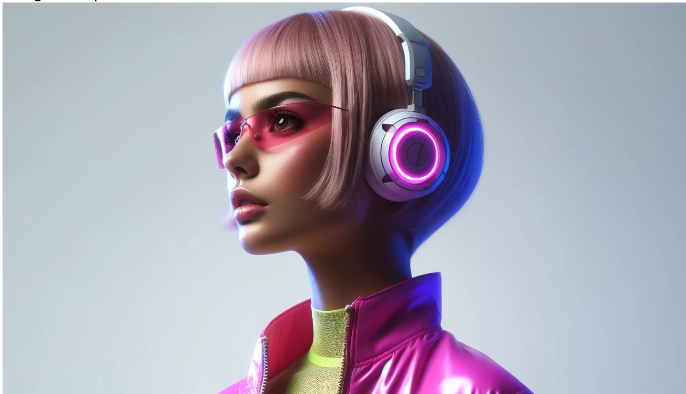
Imagen de portada

Enviado por 1020717891 el Mar, 16 Dic 2025 - 21:14