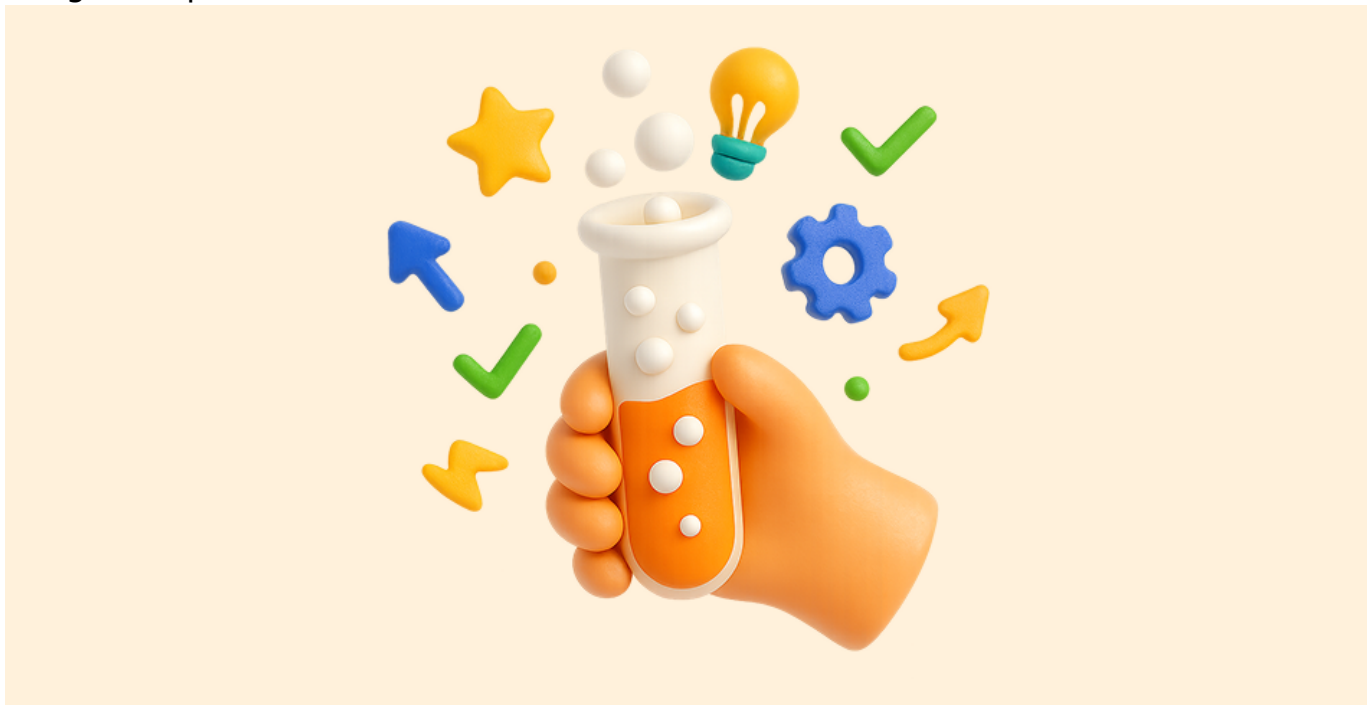
Imagen de portada

Enviado por 79569066 el Mié, 3 Dic 2025 - 22:18