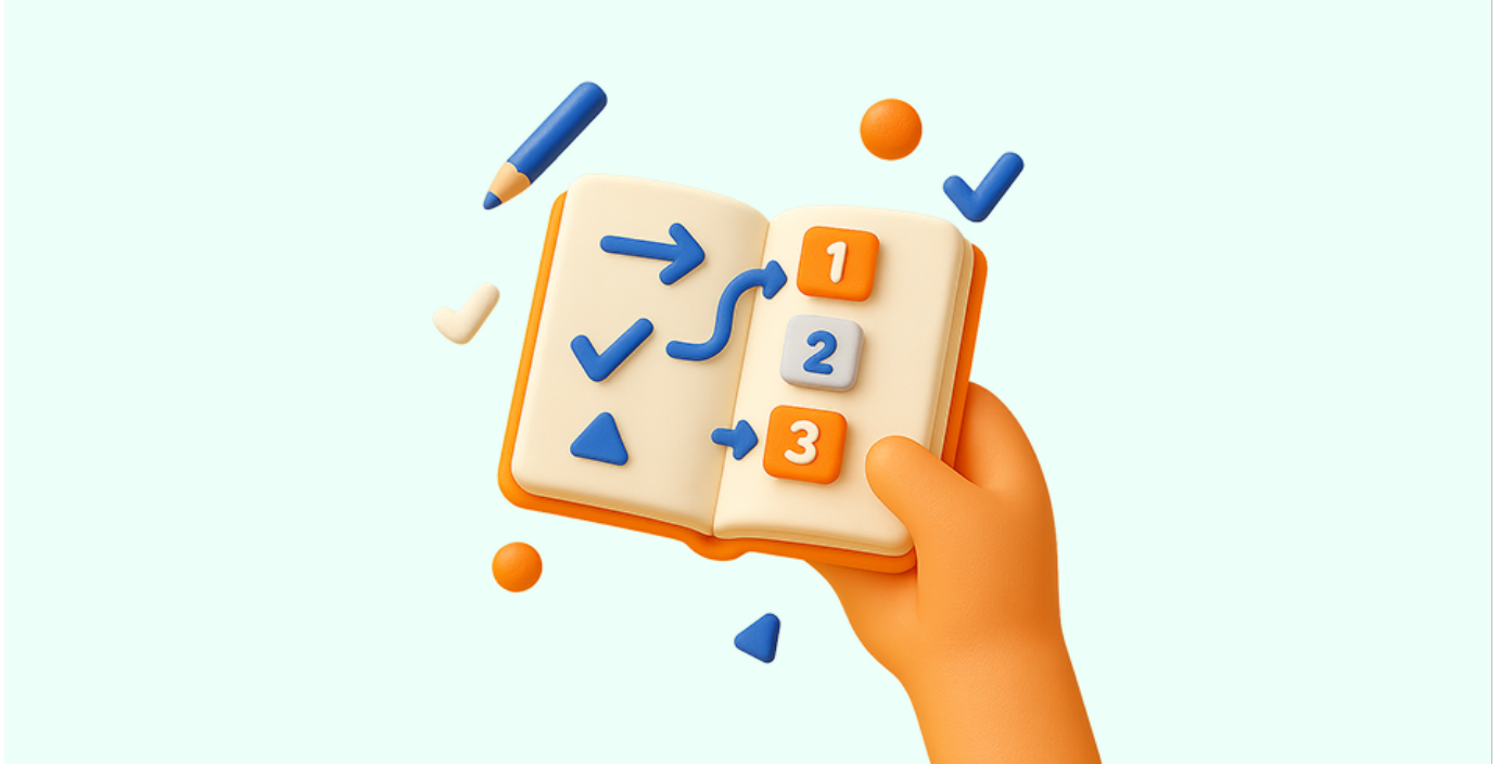
Imagen de portada

1.2 Identifica barreras para el aprendizaje