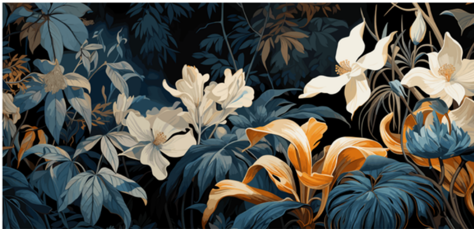
Imagen creada utilizando la función Ampliación generativa de Adobe Illustrator.

Hoy, Adobe lanza nuevas funcionalidades y actualizaciones para Lightroom, Photoshop, Illustrator y Adobe Firefly, todas ellas diseñadas para ayudarte a pasar de la idea a los resultados finales más rápido que nunca. Tanto si estás retocando cientos de fotos, ajustando la tipografía, cambiando el tamaño de gráficos vectoriales o creando un moodboard para tu próxima campaña, la última actualización de Cr